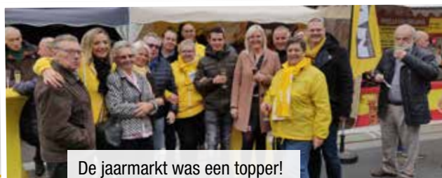
De jaarmarkt was een topper! Veel volk en gezellige babbels.