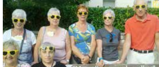
Terugblikjes p. 3