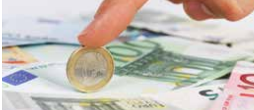
Schepen Sonck over de gemeentefinanciën p. 2